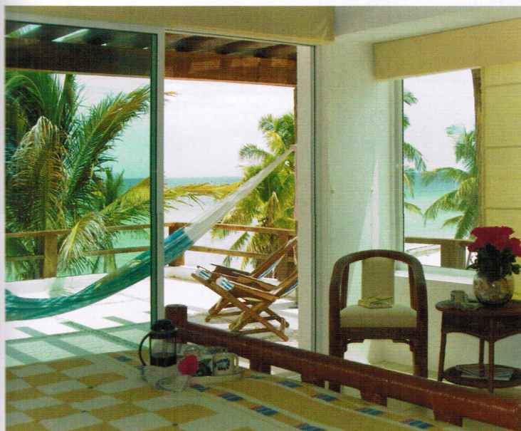
IZQUIERDA Y ABAJO: LOS DORMIOTIROS, DE DISEÑO SENCILLO, ESTÁN TODOS ABIERTOS A LA NATURALEZA. LA RECÁMARA MATRIMONIAL SE PROLONGA HACIA UNA TERRAZA PROVISTA DE MECEDORAS Y UNA COLORIDA HAMACA.